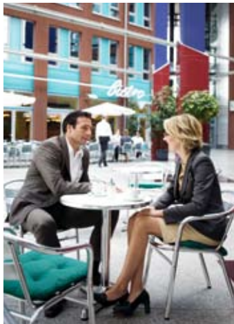
Beim Kaffee in der Bambushalle kann man sich zu jeder Jahreszeit gut entspannen.