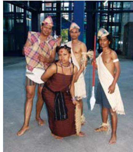
Traditionell kostümierte Tanzgruppe

Die Botschaft Madagaskars lud anlässlich des 50. Unabhängigkeitstages Madagaskars zu einem bunten Fest in die Bambushalle ein.